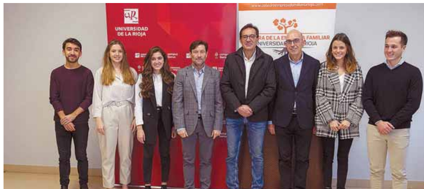
Los cinco alumnos galardonados, con los organizadores del premio Plan de Negocio de la UR.